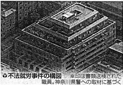
不法就労事件の構図 ※印は書類送検された職員。神奈川県警への取材に基づく

不法就労していたのは、外交官らの知人や家族で、県警は、勤務実態などについて話を聞くため、外務省を通じて大使館に面会を要請したが、外交官らは帰国。県警は6日、外交官ら3人を同法違反ほう助容疑で横浜地検に書類送検した。外交官や大使館職員が日本国内で家事使用人を雇う